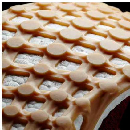
ストレッチウェブアウトソール

バネのような新感覚クッションで、かたつない走りをもたらすBOOST™フォームをミッドソールに80%搭載。どのような環境下においても、従来のミッドソール素材より優れた反発力とクッション性を発揮。