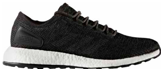
商品番号 BA8899 / コアブラック × ソリッドグレー × コアブラック