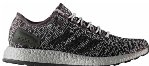
商品番号 S80701 / ソリッドグレー × ソリッドグレー × ソリッドグレー

PureBOOST ピュアブースト ¥16,000 +税 サイズ / 22.0~31.0cm