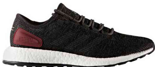
商品番号 BA8889 / コアブラック × ソリッドグレー × カレッジイトパーガンディ