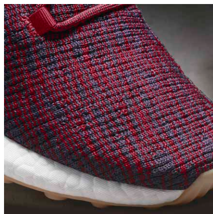
サーキュラーニット

BOOST™フォームの反発力とクッション性を引き出すストレッチウェブアウトソールを搭載。スムーズな重心移動と高い反発力・安定性をサポートするとともに、蹴り出し時には、さらなる推進力をサポートします。