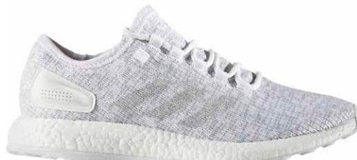
商品番号 BA8893 / ランニングホワイト × クリアグレー × ランニングホワイト

PureBOOST ltd ピュアブースト リミテッド ¥16,000 +税 サイズ / 23.0~30.0cm