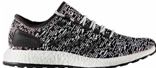
商品番号 BA8890 / コアブラック × コアブラック × ランニングホワイト

PureBOOST cl ピュアブースト カラー ¥16,000 +税 サイズ / 25.0~30.0cm ※カラーブーストフォーム搭載