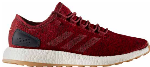
商品番号 BA8895 / カレッジイトパーガンディ × リネン × ナイトネイビー