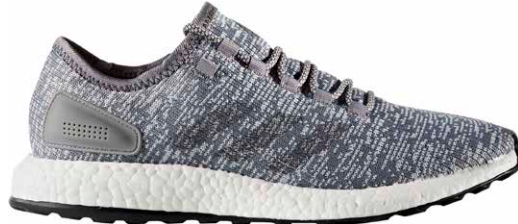
商品番号 BA8900 / グレー × ソリッドグレー × クリアグレー