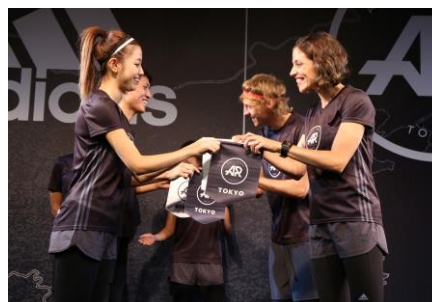
東京とベルリンでペナント交換を実施