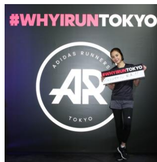
フォトブース (モデル・女優の浅見れいなさんも参加)