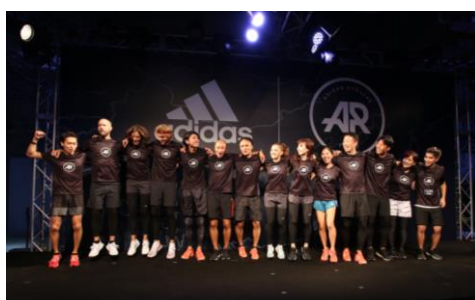
今回のイベントで優勝したチーム