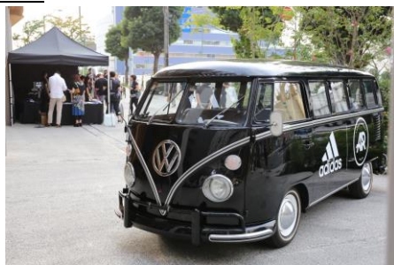
adidas Runners ロゴのラッピングカー