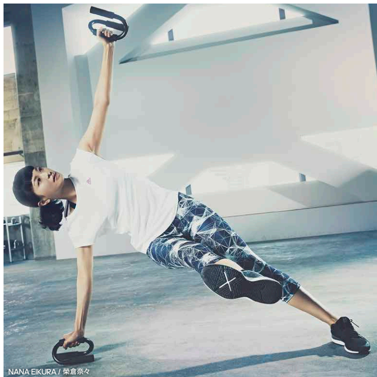
NANA EIKURA / 榮倉奈々