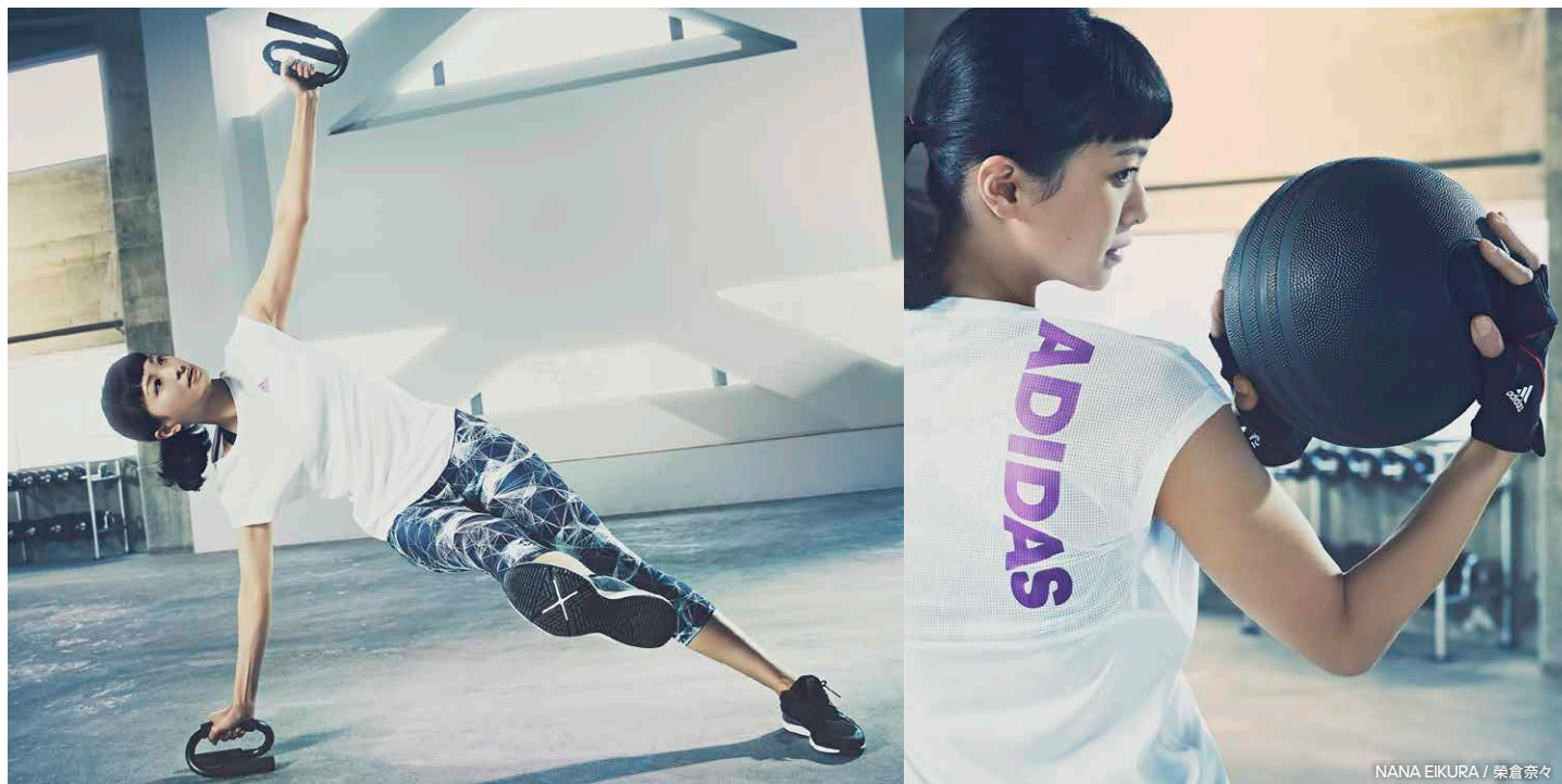
NANA EIKURA / 榮倉奈々