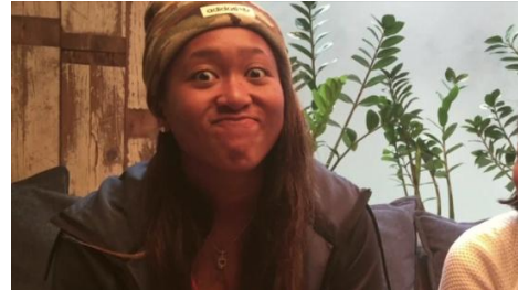
オフに見せるチャーミングな素顔