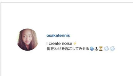
大坂選手の「クリエイター」としての格言