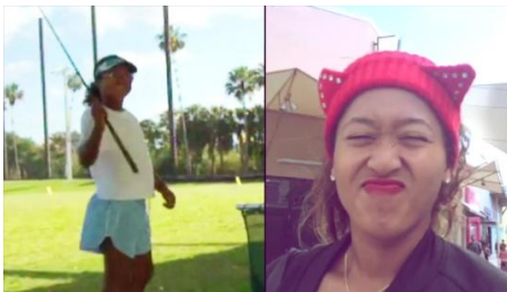
幼少期やプライベートな写真