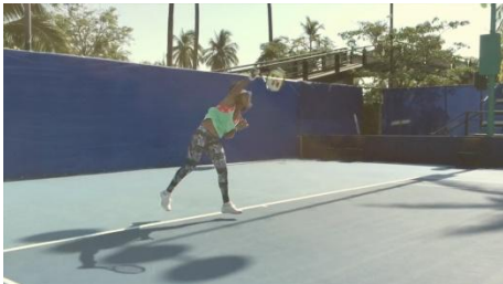
大坂選手の武器であるサーブの練習風景