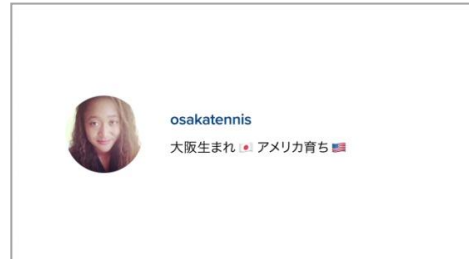
SNSをイメージした動画では、パーソナルな一面