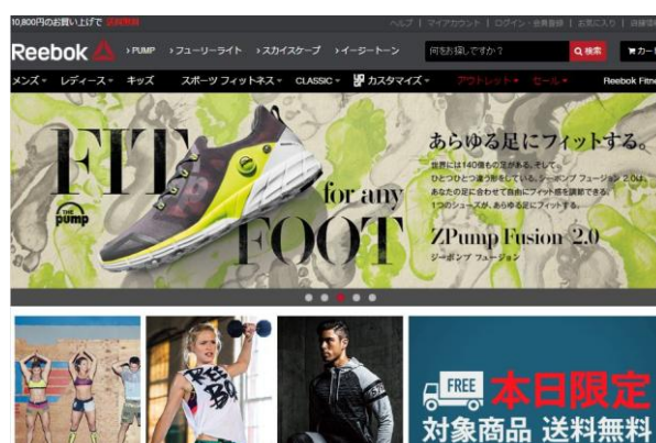
リーボック オンラインショップ Top page

マルチスポーツブランドのアディダス ジャパン株式会社（本社：東京都港区、代表取締役：ポール・ハーディスティ）は、adidas ブランドの商品を展開する「アディダス オンラインショップ ( http://shop.adidas.jp/ )」および、Reebok ブランドの商品を展開する「リーボック オンラインショップ ( http://reebok.jp/ )」の2つの自社 EC サイトにて、総合オンラインストア Amazon.co.jp が提供するサービス「Amazon ログイン&支払い」を2016年3月7日（月）より、国内スポーツ業界では初めて本格導入いたします。