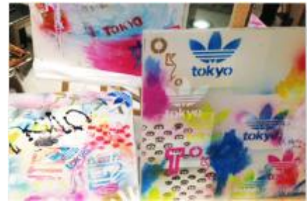
WORK SHOP イメージ

adidas Originals Flagship Store Tokyo にて、お客様ひとりひとりがクリエイティビティを表現できるワークショップを開催。シェルトゥをモチーフとしたステッカーやペーパークラフトを用意し、お客様がご自身の手で自由にクリエイティビティを發揮できる場を提供いたします。制作されたシェルトゥのアートピースは、美しいインスタレーションとして店頭で展示されていきます。