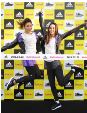
ゴールテープを模したフォトコール