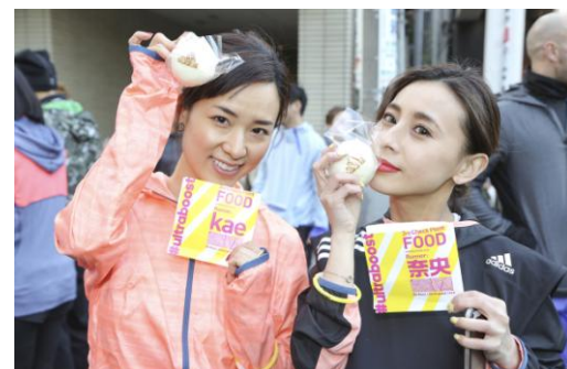
チェックポイントごとに、アトラクションを用意 ランナーの名前と adidas のロゴの入った饅頭も配られました