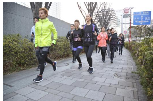
ランニングイベントも同時に開催