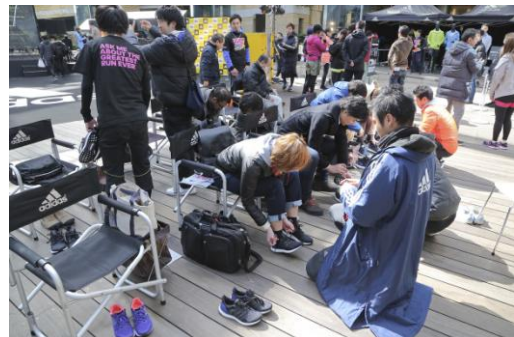
“ultra boost”を多くの方が試履きし、魅力を体感