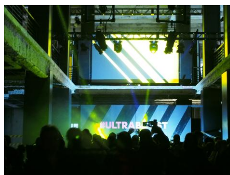
熱気に包まれた会場の様子