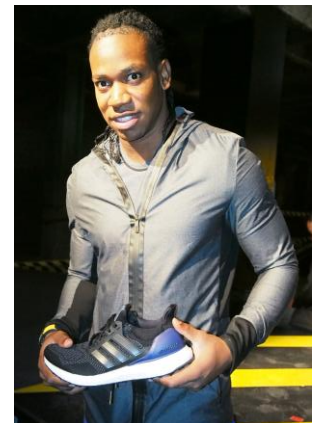
ヨハン・ブレイク