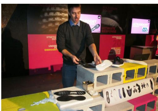
研究開発チームのブース