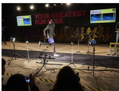
ARAMIS システムでのデモンストレーション