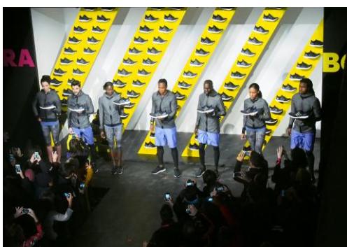
7人のアスリートによるお披露目

さらに、ultra boost を開発した研究開発チーム(adidas innovation team)もブースを展示。分解されたパーツと実験映像を用いて説得力のあるプレゼンテーションが行われ、来場者の方々に実際に素材に触れて、その機能性の高さを感じていただきました。