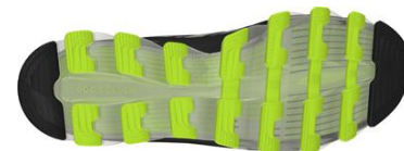
ソール部分 イメージ

また、地面との接地面となるアウトソールには、ラバー素材 adiWEAR® (アディウェア)が採用され、高い耐摩耗性能を発揮する全天候型のランニングシューズとして着用頂けます。