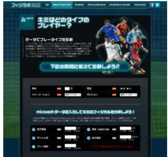
「フィジラボデータ入力画面」