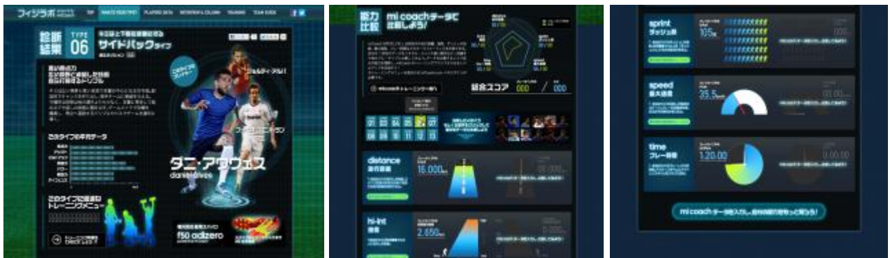
「診断結果画面：タイプ別診断、データの比較が可能」

自身のプレータイプと同様タイプの TOP 選手紹介、そのタイプに求められる能力、TOP 選手データとの比較などが可能。