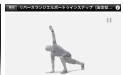
「スマートフォン画面」