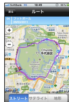
GPS 機能で走行ルートも確認