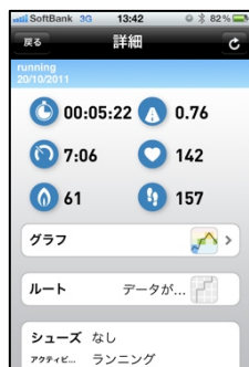
タイムリーに結果を確認