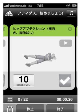
ストレッチメニュー イメージ

*2 Athletes' Performance (アスリーツ パフォーマンス)社。アリゾナを拠点とし、グローバルにエリートアスリート、スポーツチーム、リーグなどを対象とした各種トレーニングの専門家が在籍するトレーニングを主体とした法人組織