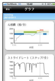
micoach.com と同期でグラフ化