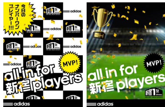
adidas camera スペシャルエフェクト

さらに、「アディダス ブランドコアストア 新宿」店内に常設されている adidas camera では、1周年を記念して、「all in for 新宿 players」をテーマにしたスペシャルエフェクト“新宿 hero (ヒーロー)”バージョンを導入し、MVP プレイヤーのヒーローインタビューのような体験を楽しんでいただけます。また、撮影した画像は公式 Facebook ページ ( adidas.jp/shinjuku ) にアップされ、自由にシェア、もしくはダウンロードを楽しめます。