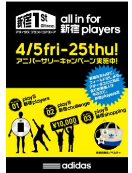
キャンペーンフライヤー