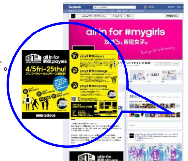
Facebook キャンペーンポスト