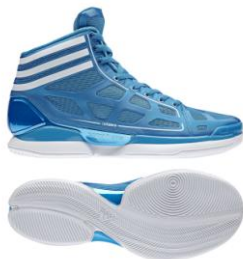
シャープブルー×ホワイト 商品番号:G22392

アディダスの象徴である3本線が足首を覆うように入ったこれまでにない新しいパターンとメッシュを使用したバッシュのイメージを覆すデザインの「adizero crazy light(アディゼロ クレイジー ライト)」は、競技だけの使用ではなく、ストリートでも履けるファッションアイテムとしても活躍するシューズです。