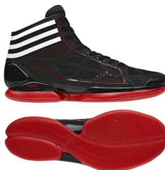
デリック・ローズ着用モデル ブラック×ホワイト×レッド 商品番号: G22389