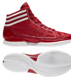
ユニレッド×ホワイト 商品番号:G21733