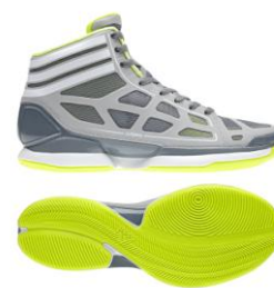
リード×ホワイト×エレクトリシティ 商品番号:G22393

商品名 : adizero crazy light(アディゼロ クレイジー ライト) カラー : 全4色 価格 : メーカー希望小売価格¥13,650(本体価格¥13,000) サイズ : 24.5~30.0cm,31.0cm,32.0cm 重量 : 約 278g*