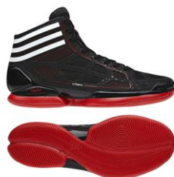
ブラック×ホワイト×レッド 商品番号:G22389