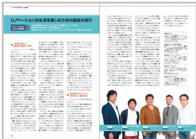
〈リノベーションのプロによる座談会〉