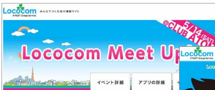
● 2011/5/14 Lococom Meet UP!

「Lococom」のキャンペーンを楽しみながら地域をさらに好きになっていただき、ユーザーの皆様と一緒に、地域を活性化していきたいと考えております。