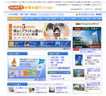
【HOME'S新築分譲マンション】