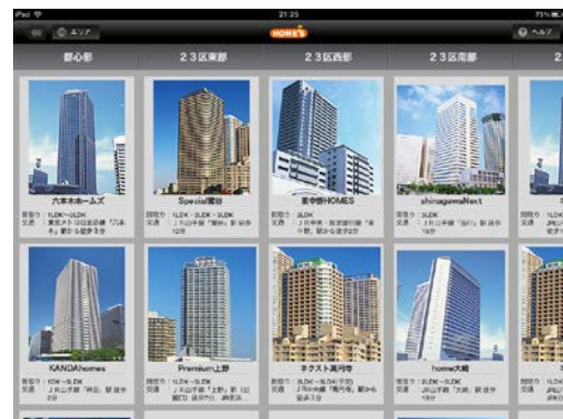
【マンション一覧画面】