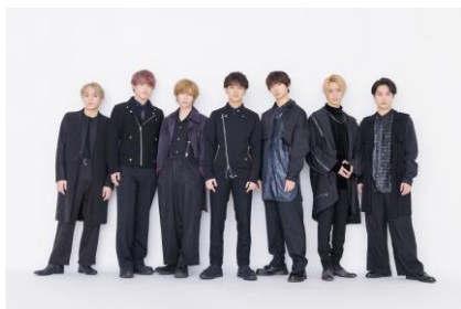
トラヴィス ジャパン