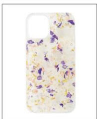
iPhone12/12Pro case CLEAR ¥7,920 (IN TAX)

ネックレスと同シリーズの、本 物のドライフラワーを閉じ込めた C型のバングル。幅が緩やかな 山型で、腕になじむシルエッ トです。