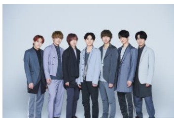
トラヴィス ジャパン

Production Manager: 林 昇平 Shohei Hayashi、齊藤 優美 Yumi Sito