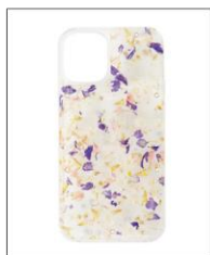
iPhone12mini case CLEAR ¥7,920 (IN TAX)