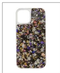
iPhone12mini case BLACK ¥7,920 (IN TAX)

iPhone12/12Pro(6.1インチ)対応の ドライフラワー入りクリアケース。1 つ1つ花を挿み、丁寧に手作業で 樹脂の中に閉じ込めた特別なプレ ートを使用。花の配置や色彩は1 つとして同じ物が存在しない、世 界にたった1つのケースです。「瞬 と永遠」を数字に置き換え、0と 9の組み合わせでつくられたANE VERのロゴマークを背面に刻印。 土台のクリアケースの内側には小 さなドット加工が施されており、 iPhoneがケースにびつたりくっ ついてしまうのを防ぐため、グ レア現象が起きにくい仕様にな っています。同シリーズでiPhone 11/11Pro用のケースもご 紹介します。