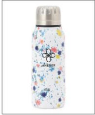
【SEDUM】 MINI BOTTLE WHITE ¥3,630 (IN TAX)

SEDUM (セダム) と名付けられた フラワープリントの透明ポーチ入り で、Tシャツを取り出した後はポ ーチとしても、またそのままギフトバ ッケージとしてもご使用いただけます。 SEDUMは、本物の花を閉じ込め たアクリル樹脂をスキャンしてつく られた花柄。花言葉は「星の輝き」 で、5枚花弁が真上から見ると星形 に見えることが由縁とされています。 5色展開で、花にちなんだカラー展 開となっています。