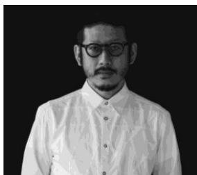
アンリアルエイジ

NF(Night Fishing)を発起人としてスタートさせ、各界のクリエイターとコラボレーションを行いながら多様な活動も行なっている。