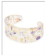
C DOME BANGLE CLEAR ¥3,300 (IN TAX)

ネックレスと同シリーズの、本 物のドライフラワーを閉じ込めた 六角形のバングル。アクリルシ ートから切り出して、丁寧に 磨き上げました。