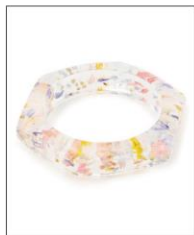
HEXAGON BANGLE CLEAR ¥7,700 (IN TAX)

本物の花をとしこめた球体と多 面体のビーズをランダムに配した チェーンネックレス。美しいプリ ズムが1つになって、首元を彩り ます。1粒ごとにドライフラワー の入り方が異なるビーズは、同 じものが存在しない1点ものの 美しさです。