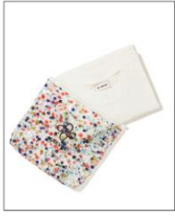
【SEDUM】 T-SHIRT IN FLOWER POUCH WHITE ¥13,200 (IN TAX)