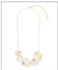
POLYGON NECKLACE CLEAR ¥7,700 (IN TAX)

ANEVERのロゴマークチャームを 繋いだ、真鍮のチェーンブレスレ ット。ロゴは「瞬と永遠」を数字に 置き換え、0と9の組み合わせでつく られた花のかたちです。数字の世界 と花が咲く自然界は対極にありま すが、ロゴマークの上で1つに交わり ます。永遠を表す数字の「9」に ちなみ、9のチャームが連なってい ます。同シリーズのネックレスもご 紹介します。