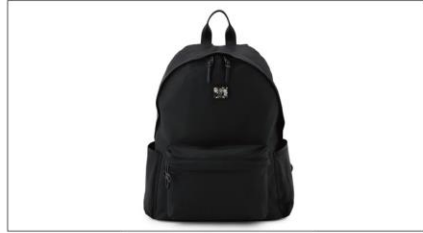
【LILAC】 NYLON BACKPACK BLACK ¥18,700 (IN TAX)

Tシャツと同じSEDUM (セダム) シ リーズの、保温・保冷用ステンレス ボトル。持ち運びに便利なミニサイ ズ(190ml)で、温かさや冷たさを そのままに“飲みごろ”を長時間キ ープします。SEDUMはドライフラ ワーを封入したアクリル樹脂からつ くった、本物のフラワープリント。花 言葉は「星の輝き」で、5枚花弁が 真上から見ると星形に見えることが 由縁とされています。スタイリッシュ なデザインと優れた機能を備える キッチンウェアブランド【thermo mug/サーモマグ】とのコラボ商品 で、同シリーズMINI TANK (ス プジャー300ml)もご紹介します。