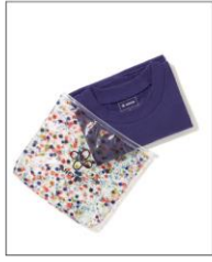
【SEDUM】 T-SHIRT IN FLOWER POUCH PURPLE ¥13,200 (IN TAX)