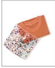
【SEDUM】 T-SHIRT IN FLOWER POUCH ORANGE ¥13,200 (IN TAX)