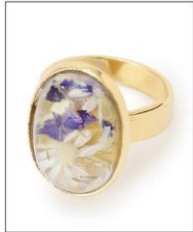
OVAL RING GOLD ¥6,050 (IN TAX)

オーバル型の金属枠にはめ込んだ フラワーアクリルパーツが、存在感 を放つリング。1つつドライフラ ワーの入り方が異なる製法で、同じ 花柄が存在しない1点ものの美しさ です。調整可能なフリーサイズな ので、プレゼント用にも気兼ねなくお 使いいただけます。