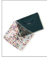
【SEDUM】 T-SHIRT IN FLOWER POUCH GREEN ¥13,200 (IN TAX)