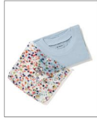
【SEDUM】 T-SHIRT IN FLOWER POUCH BLUE ¥13,200 (IN TAX)

SEDUM (セダム) と名付けられた フラワープリントの透明ポーチ入り で、Tシャツを取り出した後はポ ーチとしても、またそのままギフトバ ッケージとしてもご使用いただけます。 SEDUMは、本物の花を閉じ込め たアクリル樹脂をスキャンしてつく られた花柄。花言葉は「星の輝き」 で、5枚花弁が真上から見ると星形 に見えることが由縁とされています。 5色展開で、花にちなんだカラー展 開となっています。