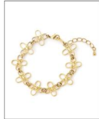
LOGO CHARM BRACEL ET GOLD ¥7,700 (IN TAX)

ANEVERのロゴマークチャームを 繋いだ、真鍮のチェーンブレスレ ット。ロゴは「瞬と永遠」を数字に 置き換え、0と9の組み合わせでつく られた花のかたちです。数字の世界 と花が咲く自然界は対極にありま すが、ロゴマークの上で1つに交わり ます。永遠を表す数字の「9」に ちなみ、9のチャームが連なってい ます。同シリーズのネックレスもご 紹介します。