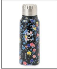
【SEDUM】 MINI BOTTLE BLACK ¥3,630 (IN TAX)

Tシャツと同じSEDUM (セダム) シ リーズの、保温・保冷用ステンレス ボトル。持ち運びに便利なミニサイ ズ(190ml)で、温かさや冷たさを そのままに“飲みごろ”を長時間キ ープします。SEDUMはドライフラ ワーを封入したアクリル樹脂からつ くった、本物のフラワープリント。花 言葉は「星の輝き」で、5枚花弁が 真上から見ると星形に見えることが 由縁とされています。スタイリッシュ なデザインと優れた機能を備える キッチンウェアブランド【thermo mug/サーモマグ】とのコラボ商品 で、同シリーズMINI TANK (ス プジャー300ml)もご紹介します。