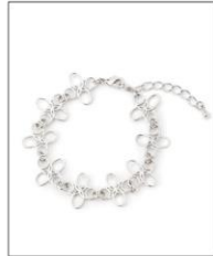
LOGO CHARM BRACEL ET SILVER ¥7,700 (IN TAX)

オーバル型の金属枠にはめ込んだ フラワーアクリルパーツが、存在感 を放つリング。1つつドライフラ ワーの入り方が異なる製法で、同じ 花柄が存在しない1点ものの美しさ です。調整可能なフリーサイズな ので、プレゼント用にも気兼ねなくお 使いいただけます。