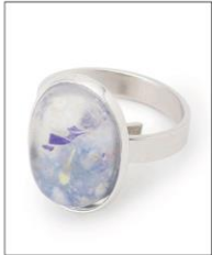
OVAL RING SILVER ¥6,050 (IN TAX)

外ポケットの引手に、ブランドロゴ のチャームがついたバックパック。 ロゴは「瞬と永遠」を数字に置き換 え、0と9の組み合わせでつくられ た花のかたちです。ドライフラワー を閉じ込めたプレートにもロゴを刻 印し、ワンポイントにしました。背 側にスポンジ素材で補強されたポ ケット付きで、PCやタブレットの持 運びに便利な仕様。A4サイズの 書類も収納可能です。シリーズ名 はLILAC (ライラック)で、花言葉は 「誇り」。リサイクルナイロンを使用 し、環境にも配慮したアイテムです。