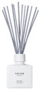
アールグレイ ルームフレグランス 200mL 4,200円+税 〔エシカル割〕 4,070円+税

リビングやベッドルームなど広い空間に、心地よい香りを広げ お部屋でのリラックスタイムをさらに心地よく演出します。 スティックの本数を変えることにより、お部屋の広さに合わせて香り方を調節できます。