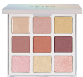
ジンジャーアイシャドウパレット(9色入り) GINGER EYE SHADOW PALETTE

2024/3/28(木) SHIRO オンラインストア(午前10時)、SHIRO全国直営店舗にて発売