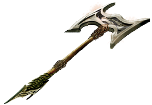
「偽ウコンバサラ」イメージ

神々の金属オリハルコンで打ち直せば「人器ウコンバサラ」となり、破壊的な攻撃力を持つ最強クラスの戦斧となる。