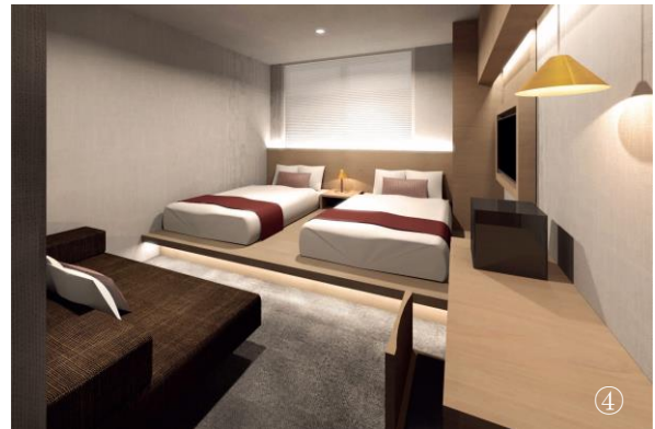
① ホテル正面玄関 ②1F共用部 ③スーペリアツインルーム ④ツインルーム ※すべてイメージ