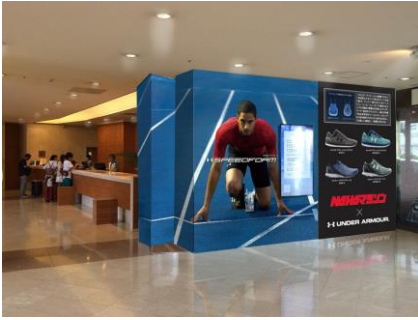
ロワジールホテル 那覇 エントランス (イメージ)