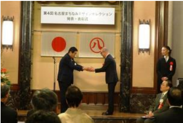
2019年3月27日、名古屋市役所本庁舎で行われた「第4回名古屋まちなみデザインセレクション」発表・授賞式