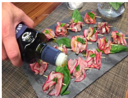
アジと赤カブのカルパッチョ