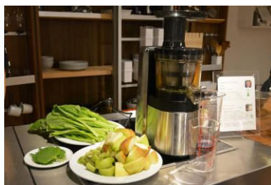
グリーンフルーツ&ベジのコールド プレスジュース