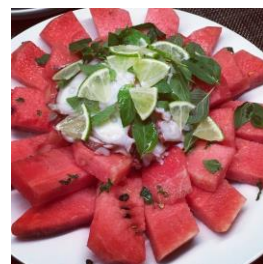
スイカのマリネ アップルミントとライムの香り