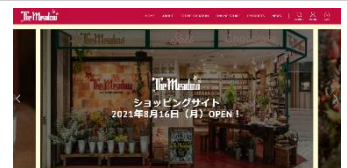
▲オンラインショップ ページイメージ