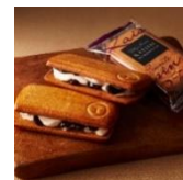
【タリーズコーヒーセレクト】 レーズンサンド