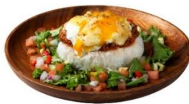
【ヴィレッジヴァンガードダイナー】 焼きチーズタコライス