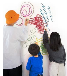
※画像はイメージです。