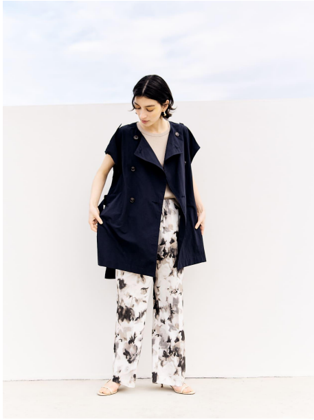
Gilet Layered Light Coat 34,100 yen Blur Printed Pants-short & regular 19,800 yen