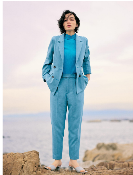
Linen Like Tailored Jacket 25,300 yen Wrinkle High Neck Mellow Tops 11,000 yen Linen Like Tapered Pants-short & regular 17,600 yen