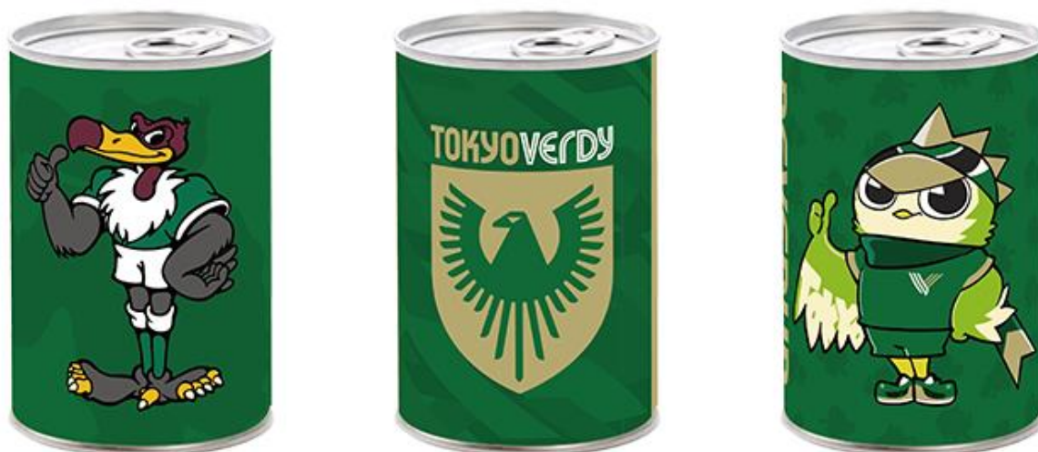
ラベルはエンブレム(中央)、マスコットのヴェルディ君(左)、リヴェルン(右)をデザインした3種類

今後もスポーツチームとのコラボ商品、折々の記念品・贈答品を企画・販売していく予定です。