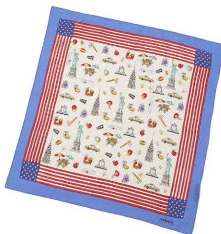
ニューヨーク ポップパターン スカーフ

ニューヨークシティの風物をコミックタッチで表現したオリジナルプリントが目惹くシルクスカーフ。ニューヨークシティを楽しくポップに描きました。躍動感あふれるイラストが気分も華やかに盛り上げてくれそうです。