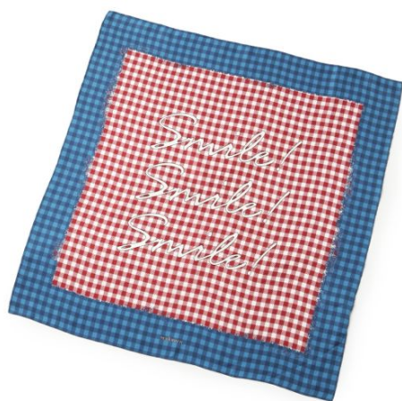
ギンガムチェック "Smile" スカーフ

ニューヨーカーが大好きなモチーフをプリント柄で表現した肌触りの良いコットン×シルク素材のスカーフ。柄の中にあるハウスタータンショッピングバックはご愛嬌。ニューヨークシティを楽しくポップに描きました。