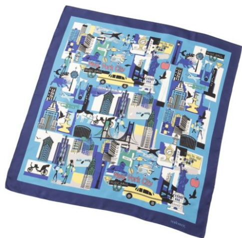
ニューヨークシティ スカーフ

ブランド設立55周年を記念し、1902年に創立し、華やかな色使いや心が弾むような柄が特長のイタリア屈指のテキスタイルメーカー Mantero (マンテロ) 社とのコラボレートスカーフを1月25日(金)より新発売いたします。2019年のテーマ「アメリカの審美眼 (American Beautiness)」とシーズンサブテーマ「GIFT FROM THE CITY -ニューヨークからの贈り物-」に因んだプリント柄が4パターン登場。トラディショナルでありながら、ポップなカラーや柄でアレンジしたデザインは、コーディネートに彩りとアクセントをプラスします。