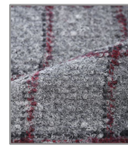
[チェック柄ジャケット] 価格: ¥63,000+税 カラー: ミディアムグレー 素材: 毛62%、ポリエステル38%