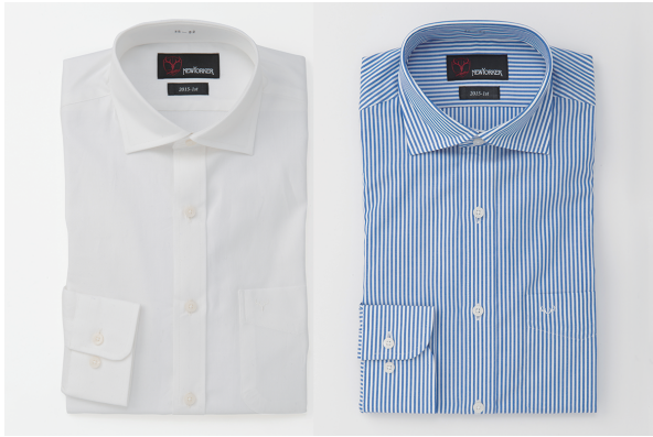
[ロイヤルオックス長袖シャツ][ロンドンストライプ長袖シャツ]

□特徴：細番手の糸を使用し、光沢感を持たせたロイヤルオックス生地を採用。(左)古くから英国紳士に愛されてきた柄ロンドンストライプは、コーディネートに合わせやすいだけでなくアクセントにもなります。(右)どちらにも胸ポケットには生地と同色刺繍で鹿島アントラーズチームマークの「Antler(アントラ)」をさりげなく配しています。