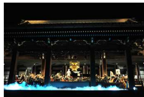
第24回 西本願寺音舞台(2011年)より