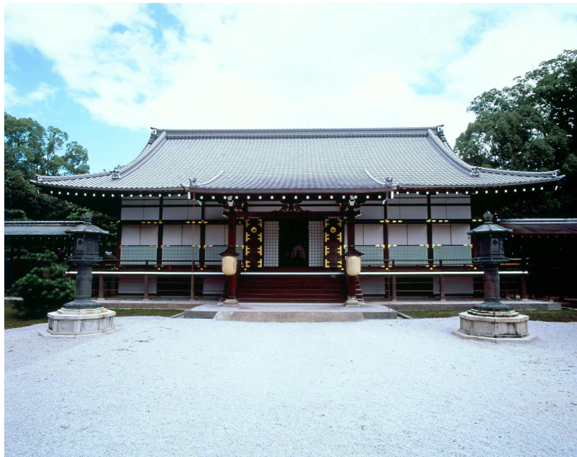
大覚寺 御影堂 (イメージ)