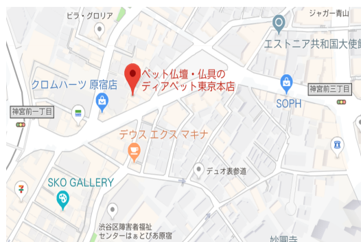
記者発表会場 ディアペット本店地図