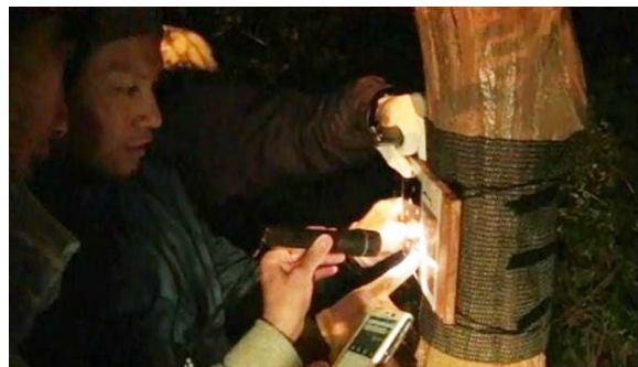
“夜のリアル宝探し” 搜索風景イメージ

“宝探し「SA GA SE(サガセ)」”は昨年11月に実施した第1弾中華街エリアを皮切りに過去5回開催してきました。参加人数は累計で2500人を超えています。参加者からは「いい運動になった」との声を多数いただき、任意のアンケートでは、参加満足度90%以上という結果を得ることができました。