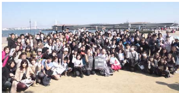
「宝探しがんばるぞっ！」と気合を入れる参加者達