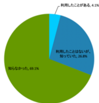
片づけ整理収納のプロの認知度・利用に関する意識調査 2022年4月当協議会が実施したインターネット調査 対象者：全国20～60代の男女1,000名