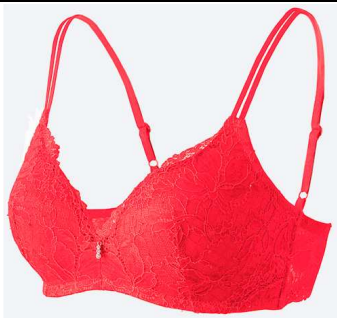
(カラー：ディープオレンジ)