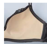
カップ裏は吸汗・速乾の メッシュ素材で快適。