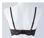
バックも総レースで プレミア感たっぷり。