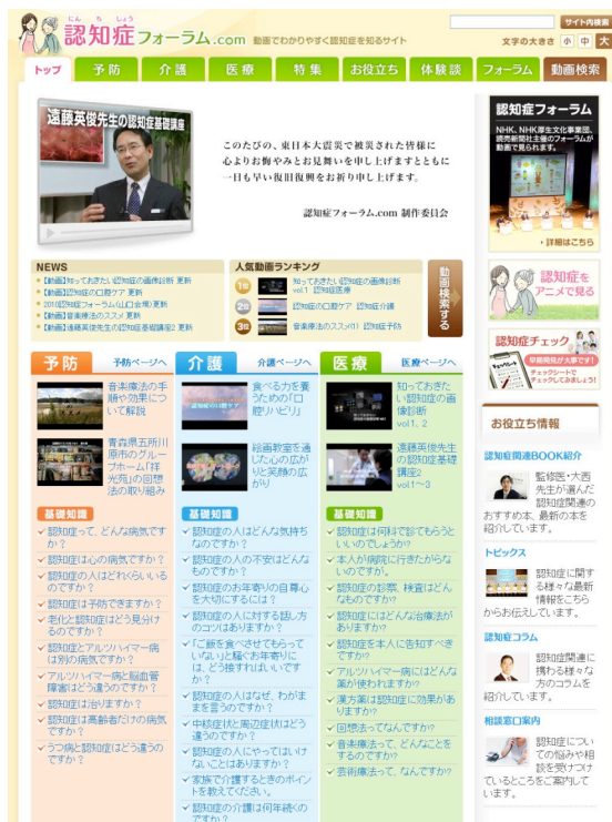
【フォーラム】動画 認知症フォーラム 三重会場