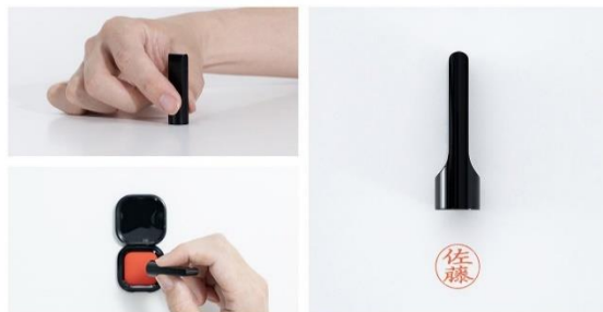
※写真はすべて商品化された商品です。

発売日：2023年4月14日にmakuakeにて先行販売。 好評につき2023年9月27日に一般販売を開始。 価格：¥4,800(税込)