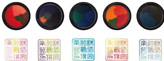
第三弾 わたしのいろ-きせつのうつろい-

発売日：2020年7月1日、8月3日にテスト販売。 好評につき9月1日に受注販売を実施。 その後、2021年6月に第二弾、2021年12月に第三弾、2022年11月に新色「ちきゅう」を発売。 価格：¥2,200(税込)