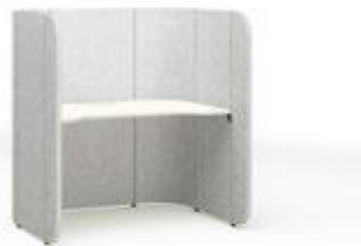
フォーカスブース(三方パネルタイプ)