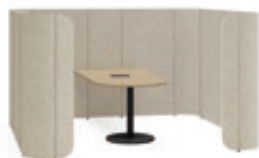
ディスカッションブース