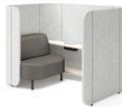
リチャージブース