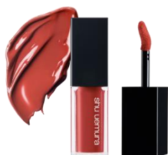
KC OR 599 ★ タソガレ