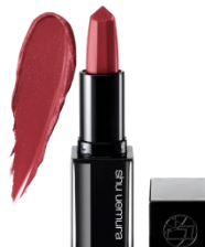
KS RD 173 ユウヤケ