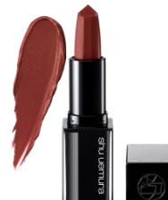
KS BR 761 ラクヨウ

日没の始まり、空が赤く変わるとき。空に残る青みも感じる落ち着いたトーンのモーヴレッド。