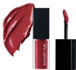
KC RD 176 ★ ヒイロ