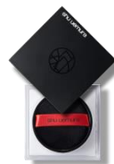
アンリミテッド mopo™ ルース パウダー