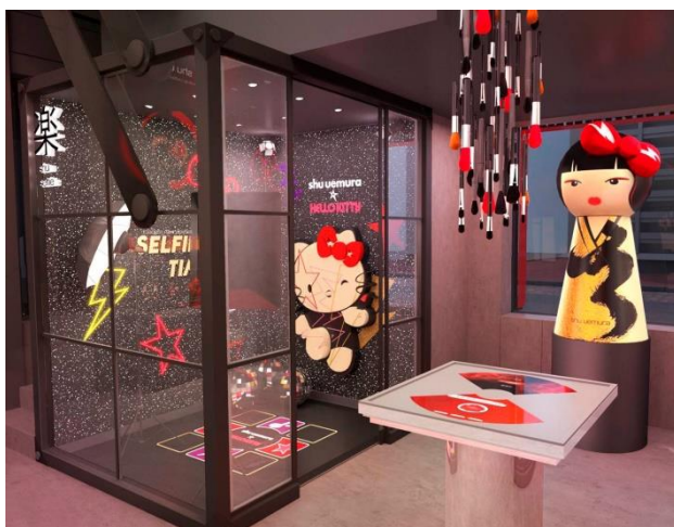
© 2021 SANRIO CO., LTD. APPROVAL NO. L614617

『shu uemura x HELLO KITTY』先行発売！グローバル フラッグシップ ビューティブティックにて、期間限定イベント“HELLO KITTYを探せ！”を 2021年10月31日(日)まで開催。店舗限定のバスオイルも同日発売。