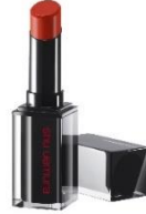
AM BR 784

洗練されたマットカラーで、知的さ漂う圧倒的な存在美。一線を画す旬顔で、今年のホリデーシーズンを決めて。