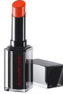
A OR 581

気分高まるカラーを纏って、ヘルシーな存在美。ホリデーシーズンに、印象もワンランクアップさせて。