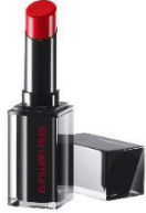
A RD 163