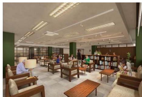
▲2階ブックラウンジイメージ