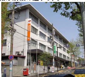
▲青葉台郵便局外観