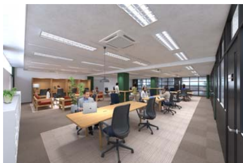
▲2階ワークラウンジイメージ