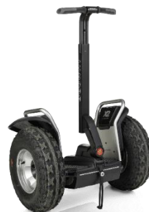
Segway PT x2SE オフロードモデル 987,000円（税別）